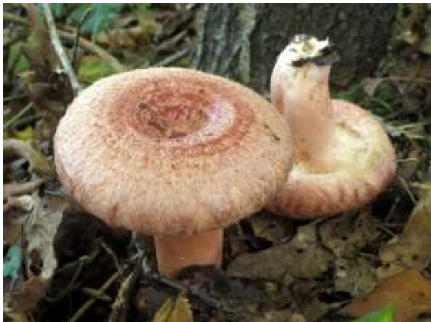
Baardige melkzwam

Als we kijken naar onze waarnemingslijst dan hebben we 4 soorten van de rode lijst gevonden. De Bruine ringboleet met de indicatie gevoelig en als kwetsbare soorten de Gele stekelzwam, Dunne weerschijnzwam en de Baardige melkzwam.