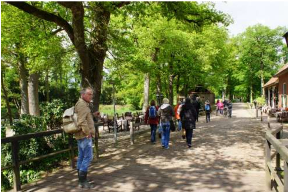
Excursie naar Singraven, Arboretum Hagelmeijen