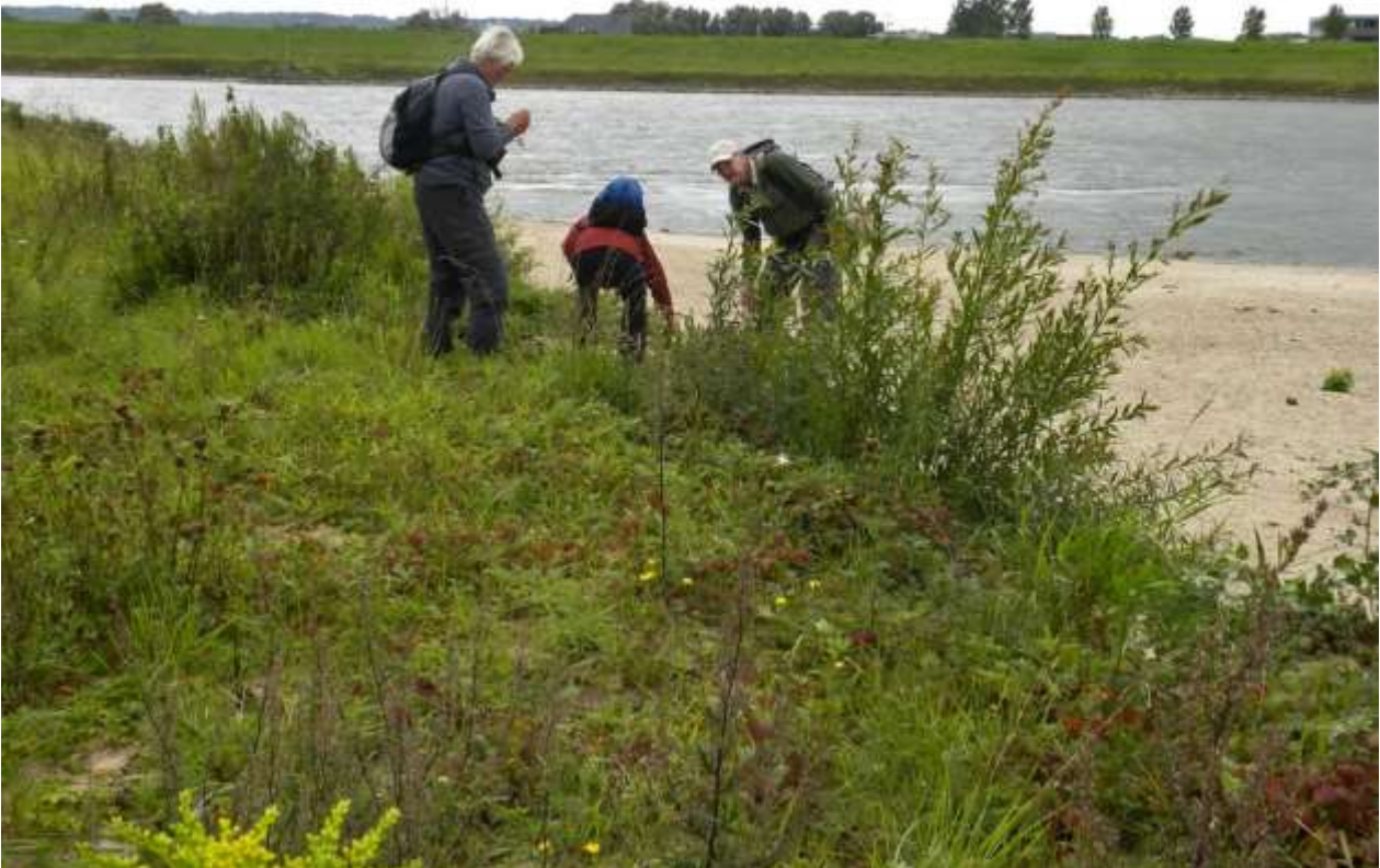
Excursie bij de Waal bij Gendt