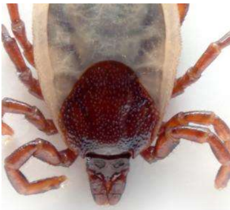
10 april 2015