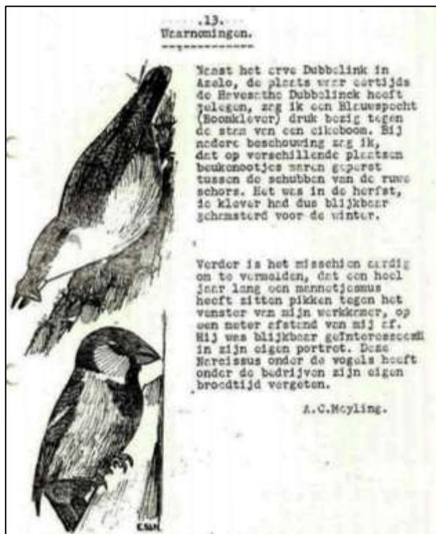
Bert Oude Egbrink

Voordat ik het blad in handen kreeg, wist ik niet wat ik kon verwachten. Als ik terug kijk, valt mij op dat er de afgelopen 50 jaar eigenlijk niet zo veel veranderd is wat betreft de activiteiten binnen de afdeling en het afdelingsblad dat we hebben. Ik heb met veel plezier het Hazepootje gelezen.