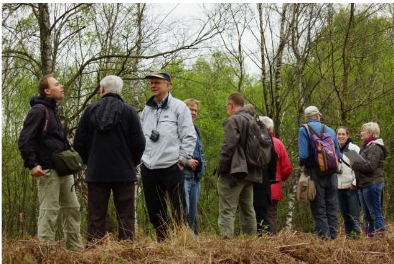
Excursie in het Aamsveen op 29 april 2012