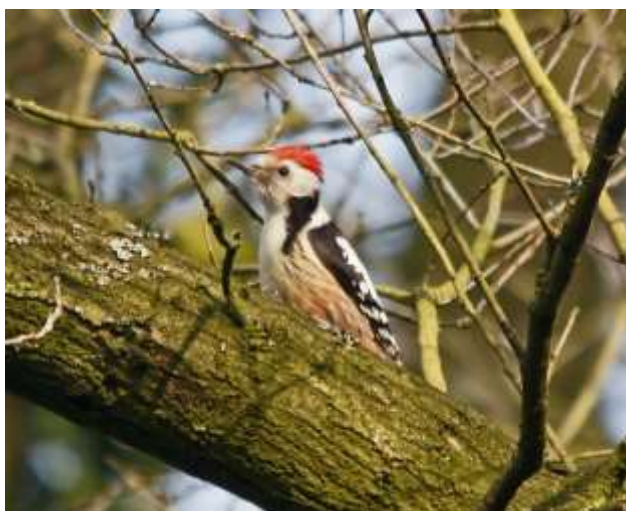
Middelste bonte specht

We zullen het centrale gedeelte van Twickel verkennen. Hier hebben we grote kans om 5 spechtsoorten te zien, o.a. de Middelste bonte specht en de Zwarte specht.