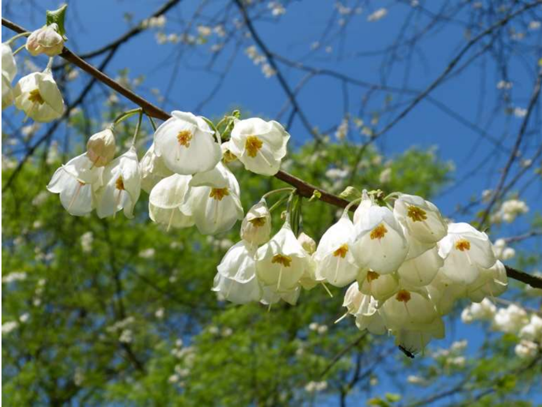
Foto 3 Wageningen - Arboretum de Dreijen Halesia monticola 19-5-2013