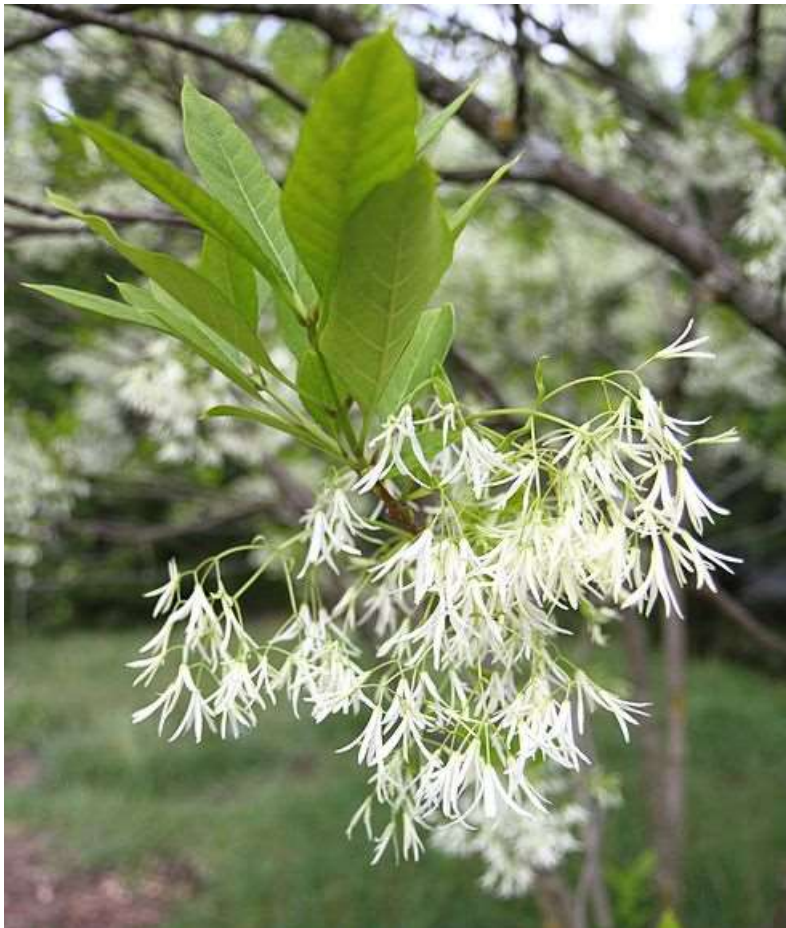
Foto 6 Chionanthus virginicus

Op Singraven vind je later in het seizoen blauwe vruchtjes bij enkele exemplaren, hier staan dus mannetjes en vrouwtjes bij elkaar. Het nieuwe seizoen staat voor de deur, het arboretum Singraven is toegankelijk voor publiek en het is schitterend om daar bloeiende Sneeuwvlokjesbomen en Sneeuwvlokjesbomen te zien.