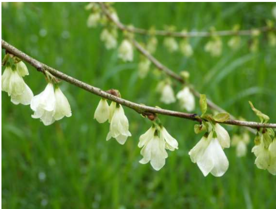
Foto 1 Denekamp - Singraven Halesia carolina 17-05-2013

Een hele toepasselijke naam eigenlijk, die een kenmerkende eigenschap van de vrucht aangeeft, echter deze naam is nu ongeldig.