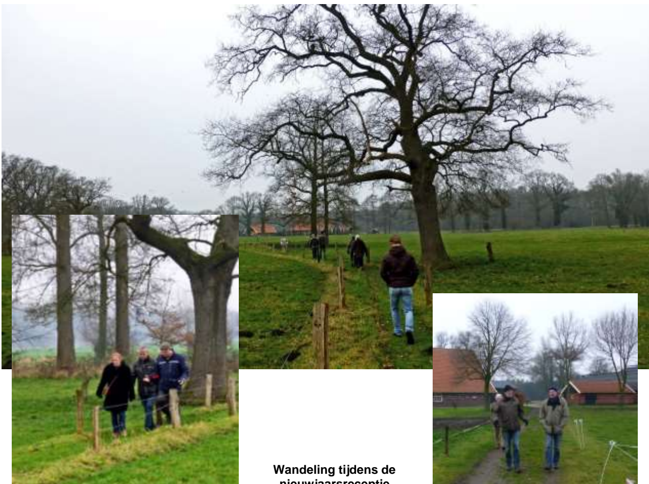
Wandeling tijdens de nieuwjaarsreceptie