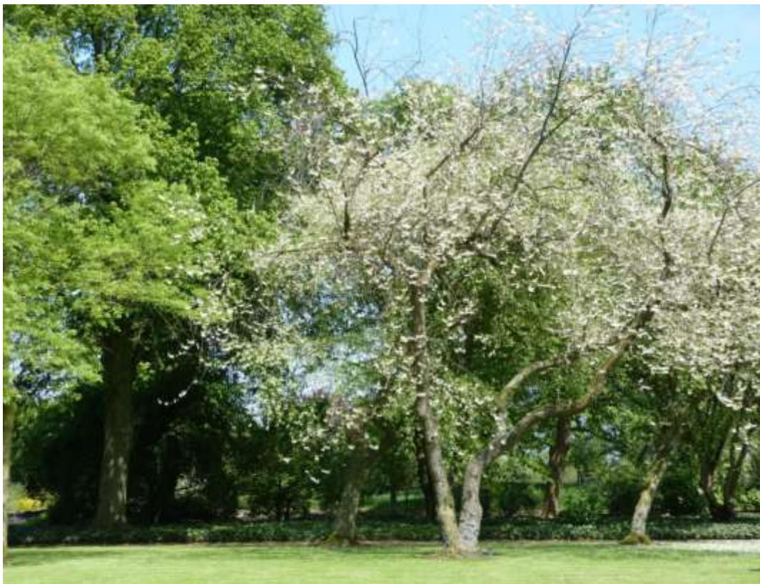
Foto 4 Wageningen - Arboretum de Dreijen Halesia monticola 19-5-2013

In Hengelo staat een heel mooi exemplaar van H. carolina aan de Van Swietenstraat. Bij gelegenheid, b.v. als je onderweg naar de Boerhavelaan voor de opstart van een excursie is het de moeite waard om in de tweede helft mei de bloei van Halesia carolina aldaar te bewonderen. (Boerhavelaan→naar Geerdingsweg→kruisingoversteken→1 ste straat links)