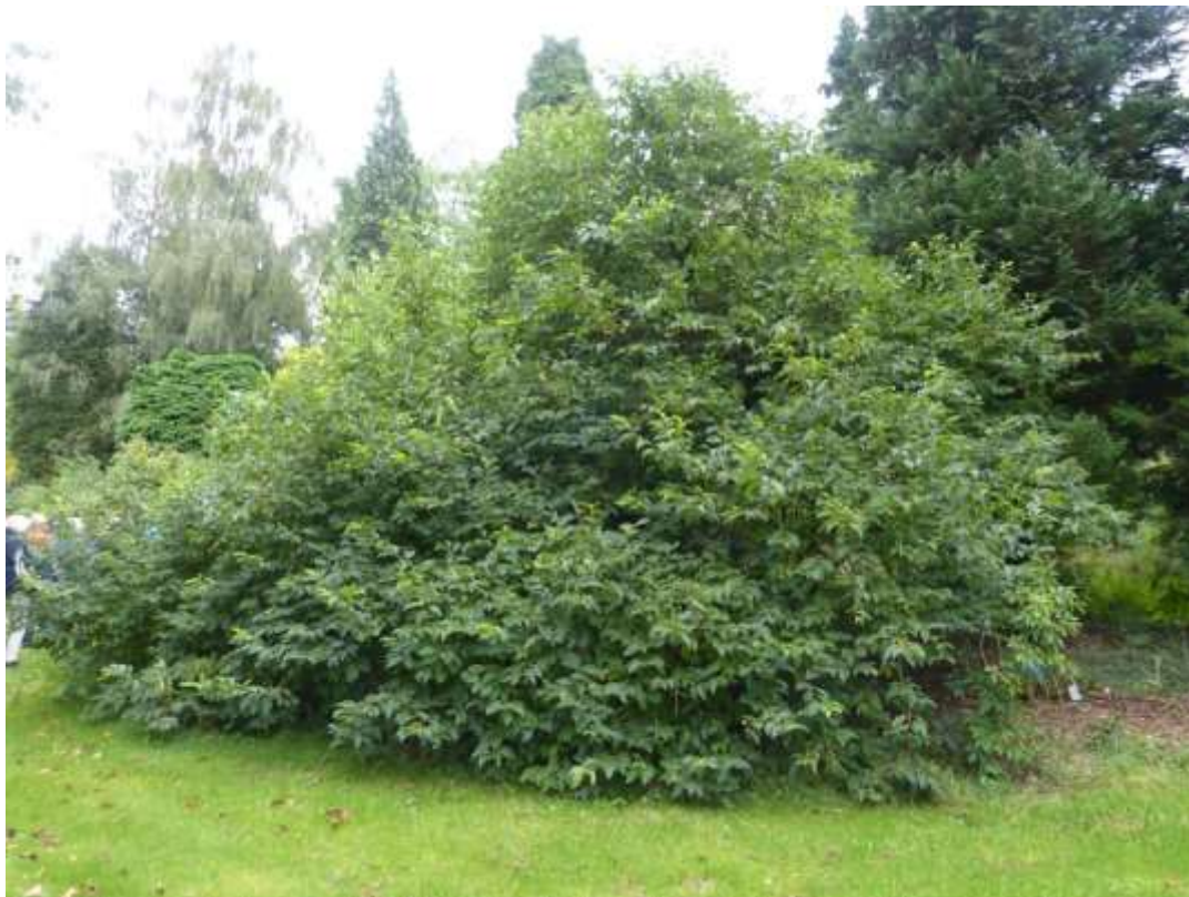
Foto 2 Doorn - Von Gimborn Arboretum Halesia carolina 19-09-2013