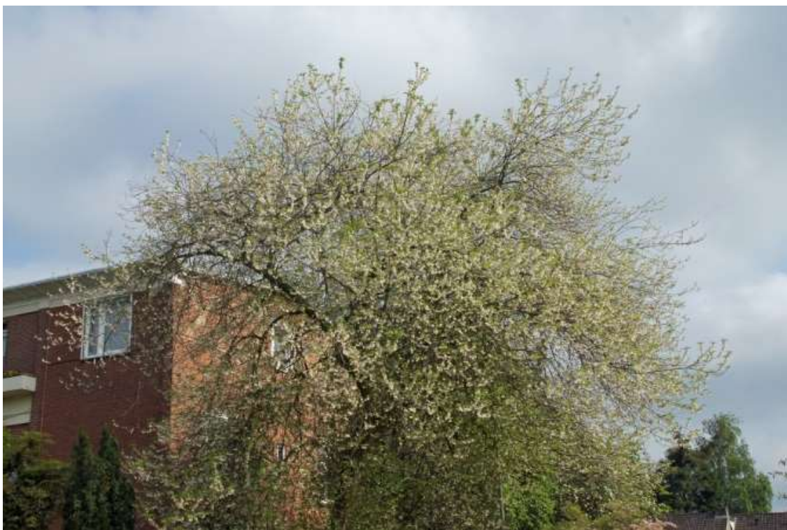
Foto 5 Hengelo - Van Swietenstraat Halesia carolina

De sneeuwvlokjesboom, Chionanthus virginicus , is een tweehuizige struik uit de familie van de olijfwilgachtigen, met o.a. ook Fraxinus en Ligustrum . De bloeiwijze is een opstaande pluim met witte bloemen, die dus een beetje op sneeuwvlokken lijken.