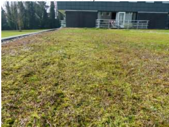
Afb.3. Sedumdak Goldstream Thiemsland

Iets verderop (Goldstream) zijn nog drie sedumdakken op ondergrondse parkeergarages. Uit de eerdere gesprekken was gebleken dat ook deze matten waarschijnlijk uit Gross Ippener komen. In het voorjaar 2014 was er medewerking voor een onderzoek, samen met Piet Kokke, op twee van de drie daken zie afb. 3)