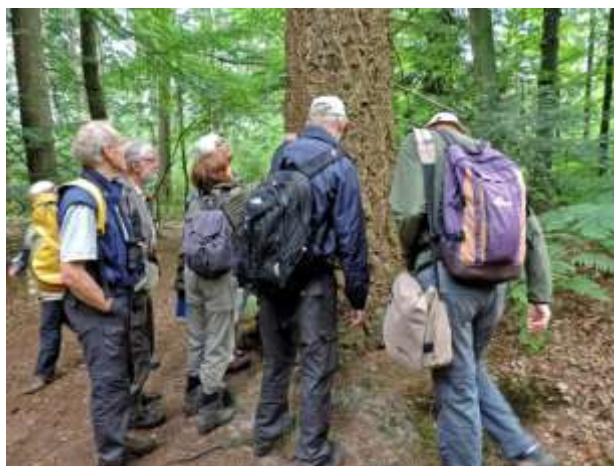
De Wildernis 22 juni 2014