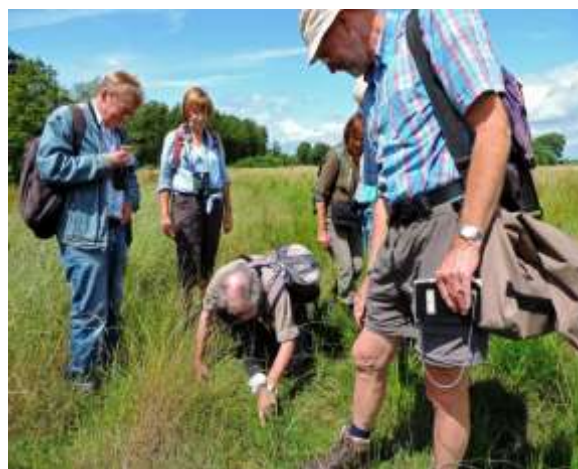
Schuilenburg 6 juli 2014