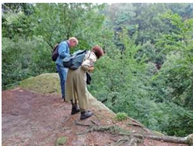
Bentheimerberge 17 juli 2014