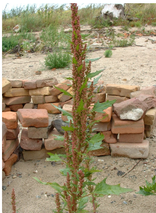
Rode ganzevoet, Chenopodium rubrum