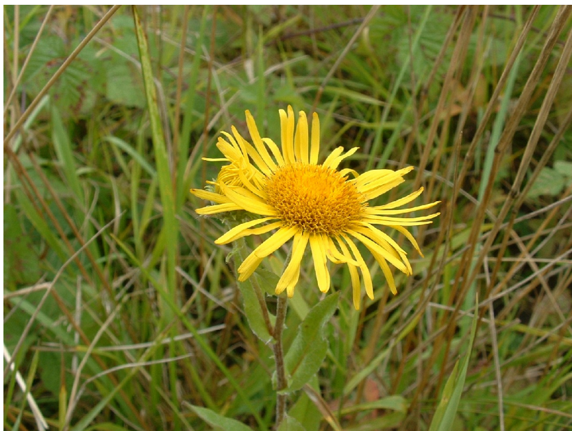
Engelse alant, Inula britannica