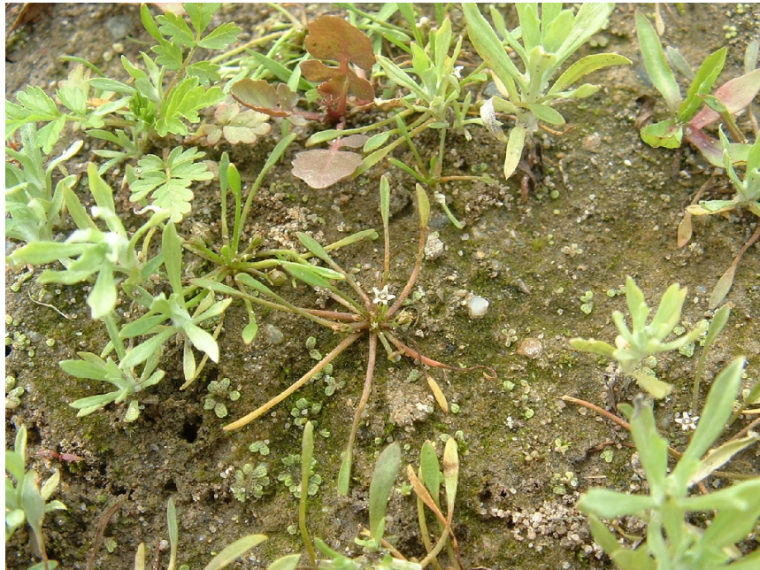
Slijkgroen, Limosella aquatica