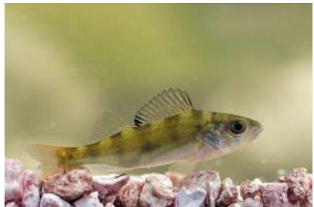
En gevangen: een Baarsje