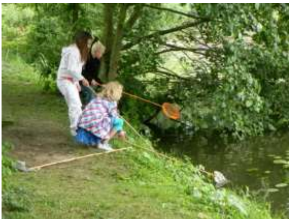
Er werd druk gevist