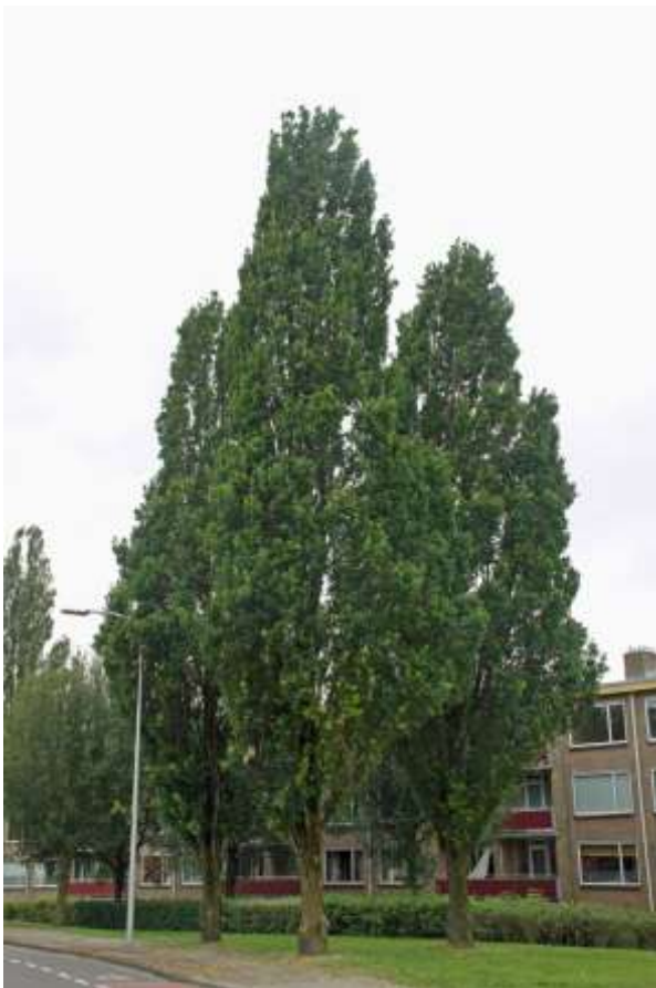
Zuilvormige zomereiken