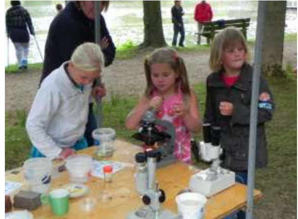
Spannend, door de microscoop kijken